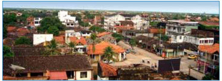
La ciudad de Trinidad, capital del departamento del Beni, espera energía eléctrica segura, continua y confiable.