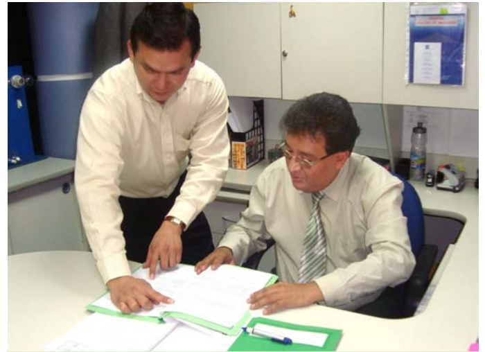
Las oficinas de la CPC están para vigilar y proteger el servicio de energía eléctrica para el ciudadano.

En la ciudad de Trinidad el CPC trabaja intensamente para atender con prontitud los requerimientos que tiene la población, inquietudes que se resumen en la necesidad de garantizar el servicio de luz, pero también, hacer conocer irregularidades que podrían estar promoviendo empleados de la empresa distribuidora.